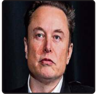
ਸੋਸ਼ਲ ਮੀਡੀਆ ਪਲੇਟਫਾਰਮ ਦੀ ਵਰਤੋਂ ਖੱਬੇ ਪੱਖੀ ਵਿਚਾਰਾਂ ਦਾ ਸਮਰਥਨ ਕਰਨ ਅਤੇ ਡੈਮੋਕਰੇਟਸ 'ਤੇ ਹਮਲਾ ਕਰਨ ਲਈ ਕਰਦਾ ਹੈ।

ਇਹ ਕਦਮ ਇੱਕ ਟੈਕਨਾਲੋਜੀ ਦਿੱਗਜ ਦੇ ਵਧ ਰਹੇ ਪ੍ਰਭਾਵ ਨੂੰ ਦਰਸਾਉਂਦਾ ਹੈ, ਜੋ 263.6 ਬਿਲੀਅਨ ਡਾਲਰ ਦੀ ਕੁੱਲ ਕੀਮਤ ਦੇ ਨਾਲ ਬਲੂਮਬਰਗ ਬਿਲੀਅਨ ਅਰਬ ਇੰਡੈਕਸ ਵਿੱਚ ਸਿਖਰ 'ਤੇ ਹੈ ਅਤੇ ਇੱਕ ਸਵੈ-ਘੋਸ਼ਿਤ ਰਾਜਨੀਤਿਕ ਸੁਤੰਤਰ ਵਿਅਕਤੀ - ਜਿਸ ਨੇ ਕਿਹਾ ਹੈ ਕਿ ਉਹ ਰਾਜਨੀਤੀ ਤੋਂ ਦੂਰ ਰਹਿਣਾ ਪਸੰਦ ਕਰਦਾ ਹੈ, ਤੋਂ ਇੱਕ ਅਜਿਹੇ ਵਿਅਕਤੀ ਵਿੱਚ ਬਦਲ ਗਿਆ ਹੈ, ਜੋ ਨਿਯਮਿਤ ਤੌਰ 'ਤੇ ਆਪਣੇ ਐਕਸ