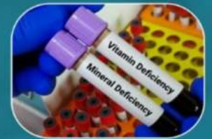
Vitamin & Nutrient Test

ਆਪਣੇ ਹੋਣ ਵਾਲੇ Baby ਦਾ Gender ਜਾਣੇ 6 Weeks ਵਿੱਚ