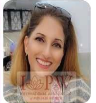
BAL K SINDAL